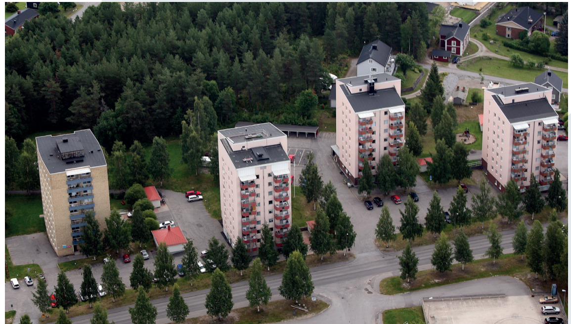
Sammanlagt sex hus ska konverteras – Start första hus, Lasarettsv 3, 2023